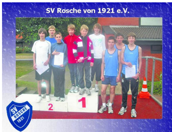
Anklicken zur Vergrößerung - Die drei Roscher Staffeln, allesamt Bezirksmeister